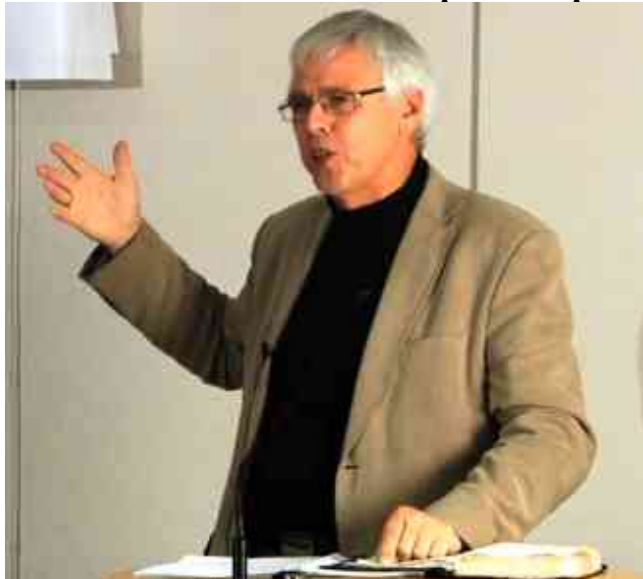
Disse 3 bibeltimer blev holdt på Birkedal lejren i 2009, hvor Luthersk Mission Kirkegårdsvej havde kredsweekend d. 28-30. august 2009.